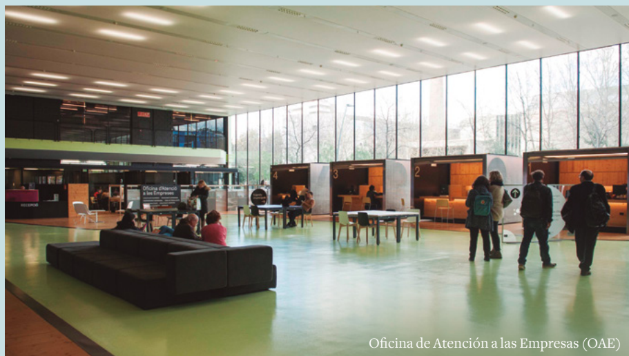
Oficina de Atención a las Empresas (OAE)