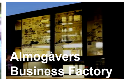
Almogàvers Business Factory