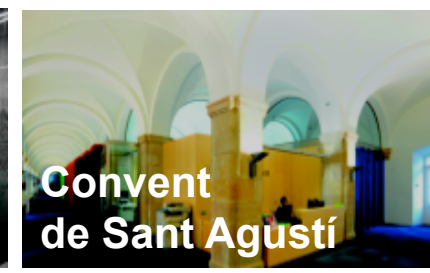
Convent de Sant Agustí