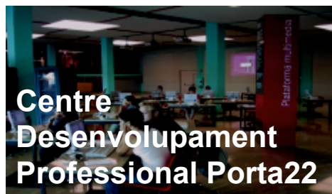
Centre Desenvolupament Professional Porta22