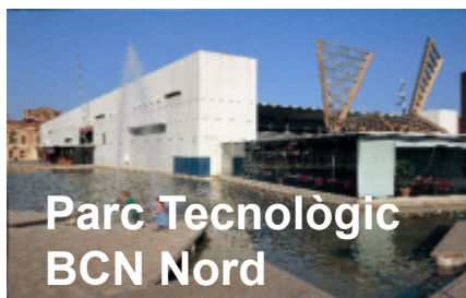
Parc Tecnològic BCN Nord