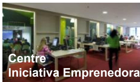
Centre Iniciativa Emprenedora